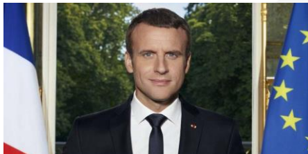
Monsieur Emmanuel MACRON

Placée sous le haut patronage du Président de la République , Grand Maître de l'Ordre, et du Grand Chancelier de la Légion d'honneur , la Société des Membres de la Légion d'honneur (SMLH) est une association type «Loi 1901», fondée en 1921 et reconnue d'utilité publique par décret du 27 mars 1922.