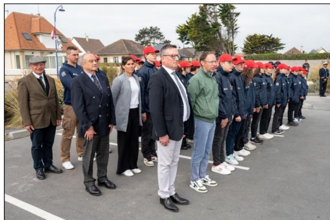
Sur les rangs lors de la cérémonie du 6 juin 2023 à Coleville-Montgomery