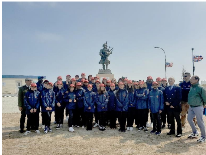
Devant le monument « Bill Millin » le 6 juin 2023 à Coleville-Montgomery