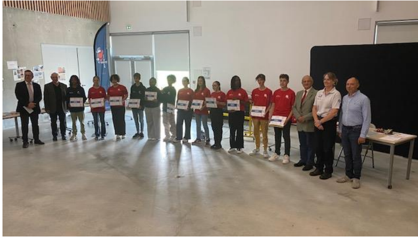
Les cadets de la SMLH ors de la remise des prix à Tréfaven le 16 juin 2023