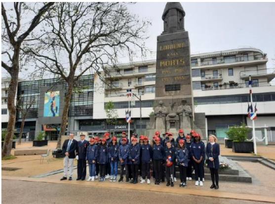
Les cadets sur la place Glotin le 8 mai 2023