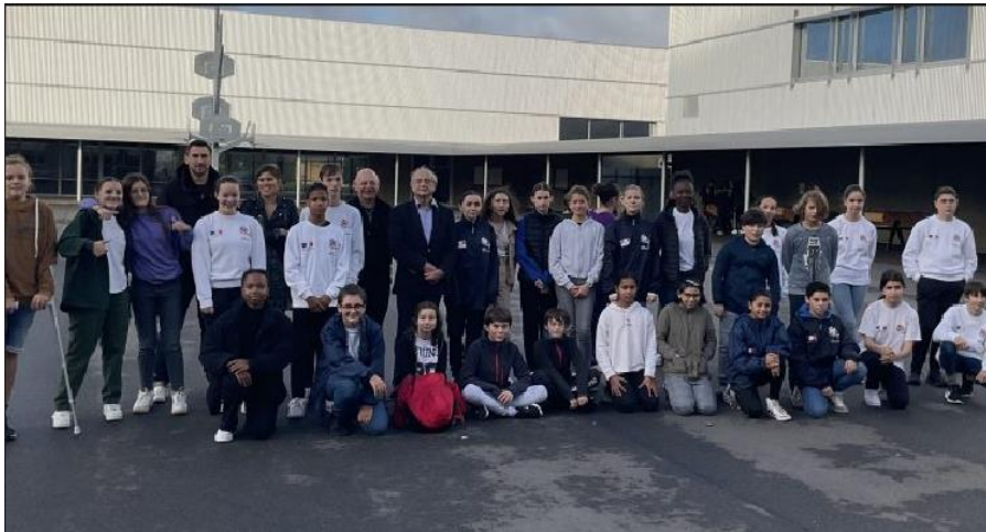
Photo de groupe à l'issue de la formation sur la citoyenneté – Tréfaven octobre 2022